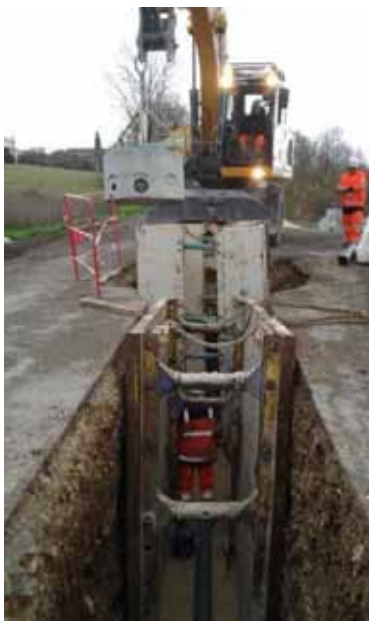
RD120 - extension du réseau d'eaux usées