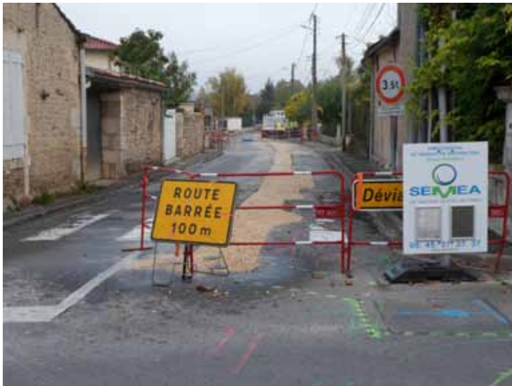
Rue des Bretons, rénovation du réseau de distribution d'eau potable