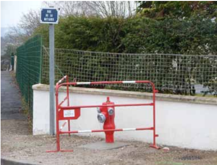
Amélioration de la protection incendie, rue de la Métairie