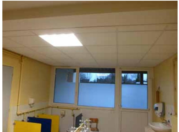
École Maternelle - Faux plafond