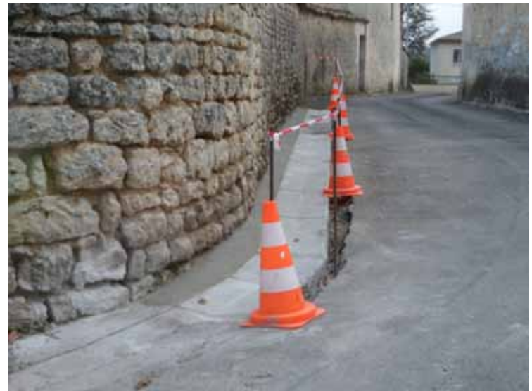
Rue Chez Siret, pose de caniveau en régie